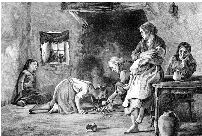
Hungernde Familie 1816

In den Regionen rund um den Vulkan sahen die Menschen in den nächsten Tagen keine Sonne mehr. Der Boden wurde unfruchtbar und somit für die nächsten Jahre unbrauchbar. Die Hungersnot und die zunehmend aufkommenden Krankheiten, haben 82'000 Menschenleben gefordert.