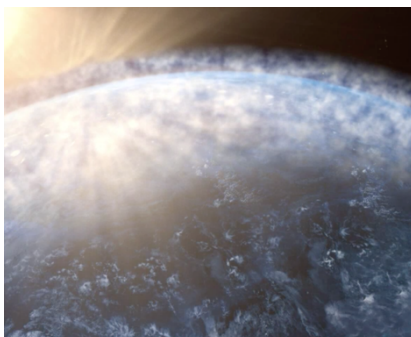
Reflektion des Sonnenlichts

Durch das Schwefeldioxid, welches in die Stratosphäre gelangt, bilden sich winzige Tröpfchen aus Schwefelsäure und Wasser, sogenannte Aerosole.