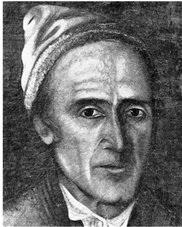
Ulrich Bräker Portrait

Ulrich Bräker wird am 22. Dezember 1735 in einem armen Dorf in der schweizerischen Region Toggenburg geboren. Die Bauernfamilie Bräker ist seit Generationen arm. Kaum trägt Ulrich die ersten Hosen, nimmt ihn sein Vater zum Arbeiten mit. Ulrichs Vater kauft sich in der Gemeinde Krynau das kleine Gut Dreyschlatt. Dafür stürzt der Vater sich in Schulden, die ihm 13 Jahre lang ein Leben in Not und Armut aufzwingen. Nach einer gewissen Zeit erwacht Ulrichs Interesse an der Lektüre. Er liest die Bibel und andere religiöse Literaturen und wird vom Pfarrer unterrichtet. Jedoch wird die Schuldenlast für die mittlerweile zehnköpfige Familie so drückend, dass der Vater trotz der erstaunlichen Geduld seiner zahlreichen Gläubiger das Gut Dreyschlatt verkaufen muss. Die Bräkers ziehen im Winter an