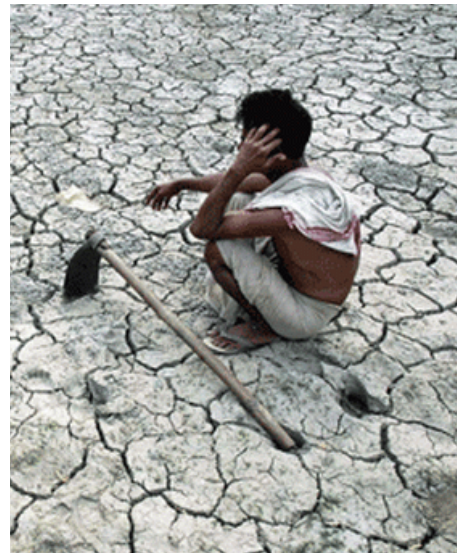
Bauernkind bei Missernte ca. 2000