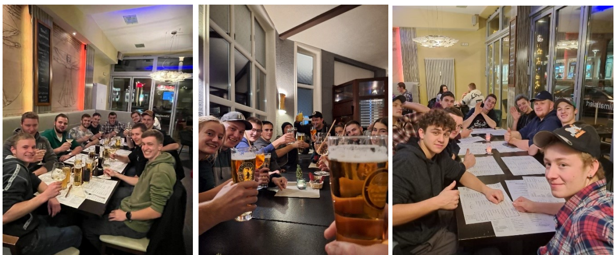
Abbildung 11: Neben den Exkursionen tagsüber, waren auch die geselligen Abende in Bruchsal ein Highlight auf der Auslandsexkursion 2023.