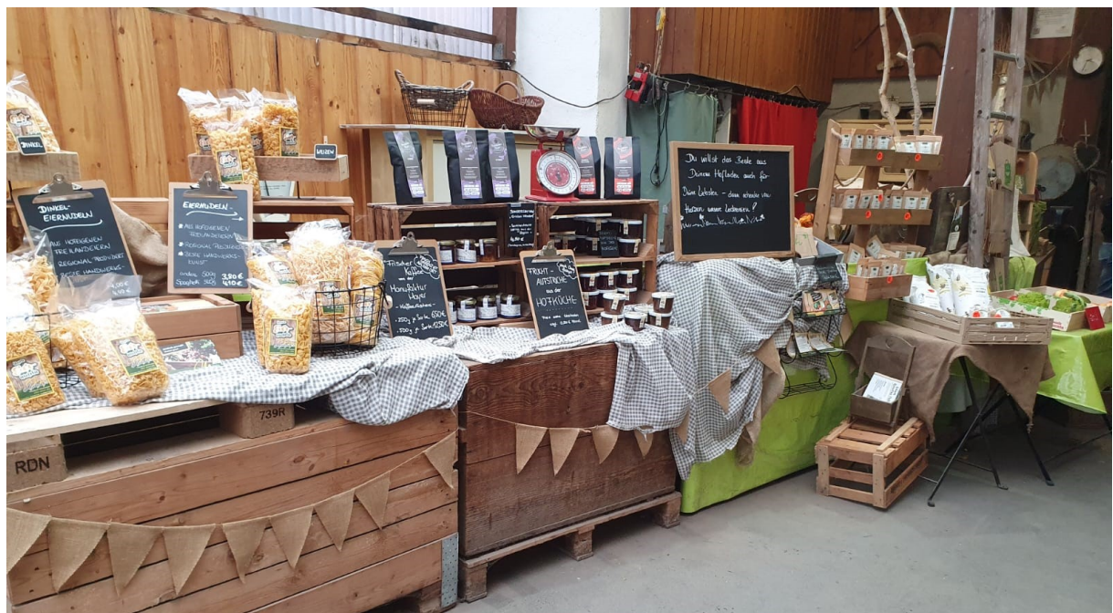
Abbildung 8: Hofladen auf dem Betrieb Melder.