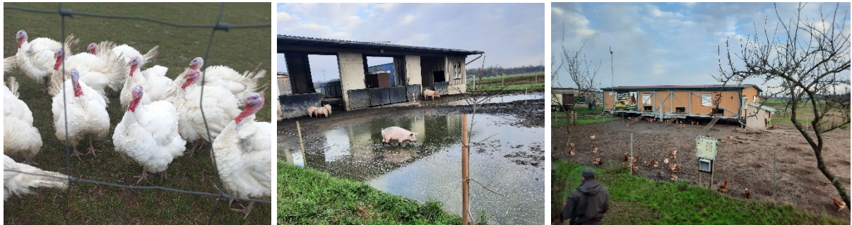
Abbildung 7: Truthähne, Wiesenschweine und mobiler Hühnerstall auf dem Betrieb von Markus Melder.

Zum Abschluss des zweiten Tages wurde der Betrieb von Markus Melder in Graben-Neudorf besucht. Seine Schwerpunktthemen sind die regenerative Landwirtschaft und die Biodiversität. Zudem zeigten er und seine Tochter uns ihre Wiesenschweine, die Freilandtruthähne und die Hühnerhaltung im mobilen Hühnerstall.