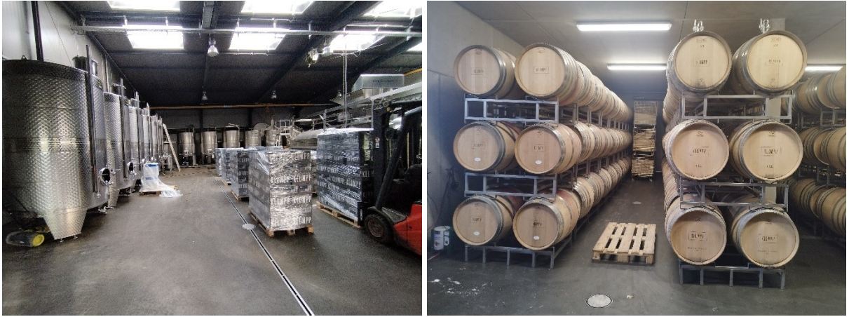
Abbildung 5: Weinlagerungs- und Produktionsräume auf dem Weingut Klumpp.

Eine weitere sehr interessante Führung bot uns das Weingut Klumpp. Das Weingut Klumpp produziert biologische Weine im Hochpreissegment. Nach einem spannenden Einblick in die Produktion, wurden im Eventraum des Weinguts zwei Weissweine und ein Rotwein zur Degustation angeboten. Anschliessend fand in der schönen Location auch das Mittagessen statt und wer wollte, durfte Wein einkaufen.