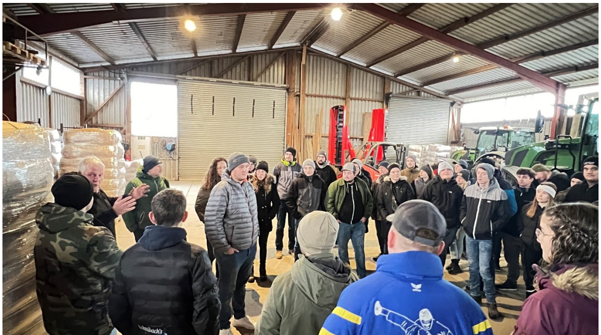
Abbildung 4: In der Maschinenhalle auf dem Betrieb der Familie Fränkle.