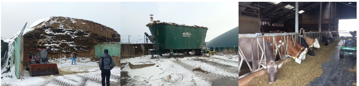
Abbildung 2: v.l.n.r. Silagelagerung für Biogasanlage, Mischer für Einsatzstoffe Biogasanlage und die Milchviehherde auf dem Eichbuschhof der Familie Berger.

Als zweites wurde der Betrieb von Marc und Jessica Berger besucht. Auf dem Betrieb wurde die betriebseigene Biogasanlage vorgestellt. Die Bemessungsleistung der Biogasanlage beläuft sich auf 250 KW, die theoretisch maximale Leistung läge bei 450 KW. Unter anderen werden im nahegelegenen Dorf diverse Wohngebäude mit Fernwärme von der Biogasanlage beliefert. Weiter werden auf dem Betrieb 65 Milchkühe gehalten, 70 Hektaren Ackerland und 70 Hektaren Grünland bewirtschaftet.