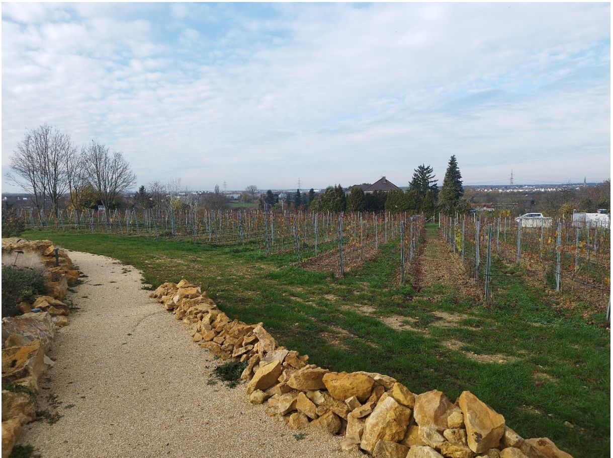
Abbildung 6: Neu angelegter biologischer Weinberg auf dem Weingut Klumpp.